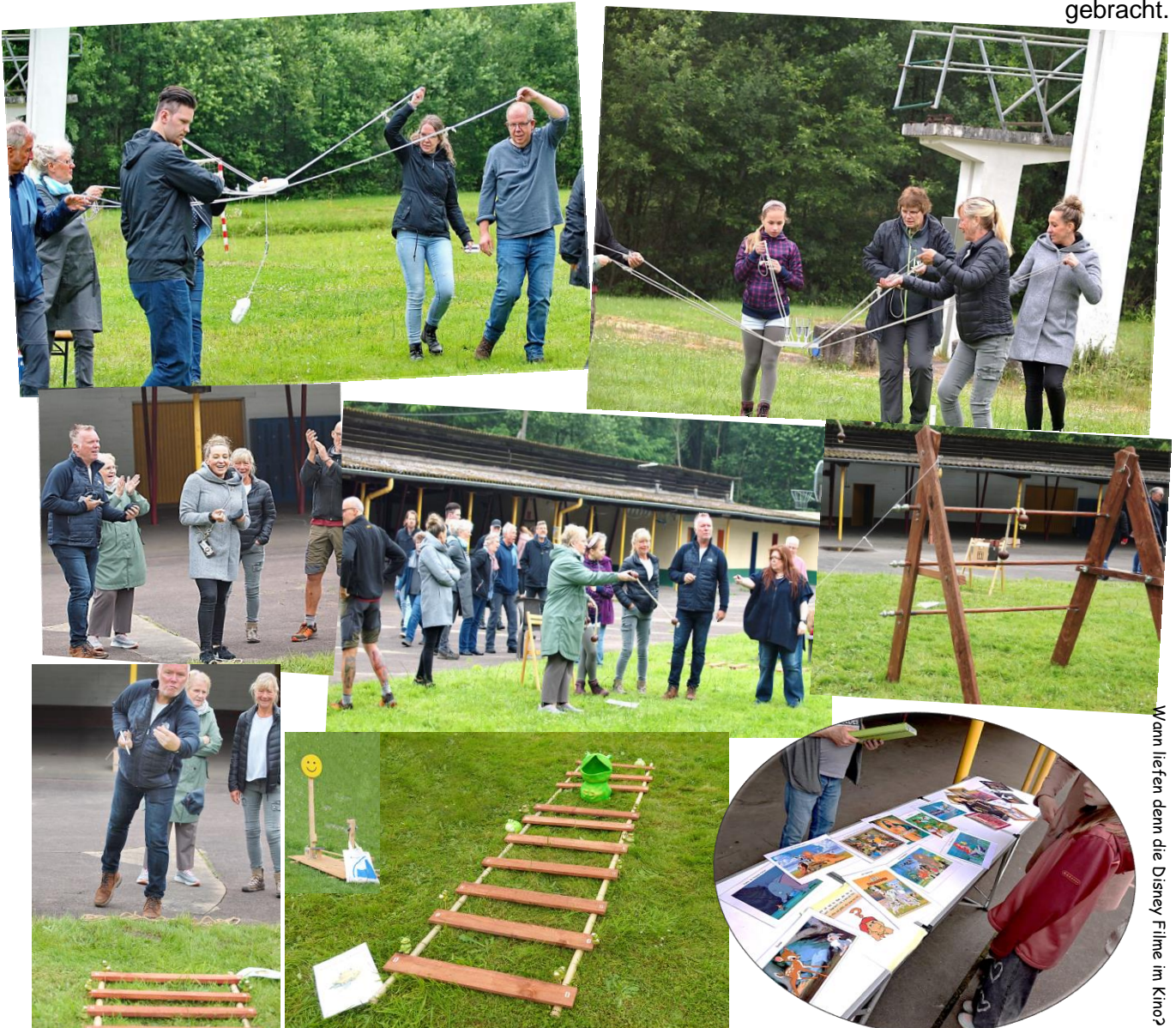
Wann liefern denn die Disney Filme im Kino?

Nachdem wir alle unsere Teller leer gegessen hatten, zeigte sich sogar die Sonne und bot damit beste Voraussetzung für die Spiele auf dem großzügigen Gelände. Dort spielten dieses Mal „die Bären“ Gegen- und miteinander. Ich weiß gar nicht mehr ob die Him-Bären oder die Wasch-Bären gewonnen haben...oder waren es die Panda-Bären? Ich glaube die Gruppe von Käpt'n BlauBär waren nicht vorne, sondern die Erd-Bären oder gar umgekehrt? Jedenfalls hat es allen viel Spaß gemacht und in Schwung gebracht.