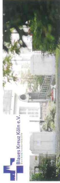
Blaues Kreuz Köln e.V. Suchtambulanz

Email: fachstelle-bk-koeln@netcologne.de