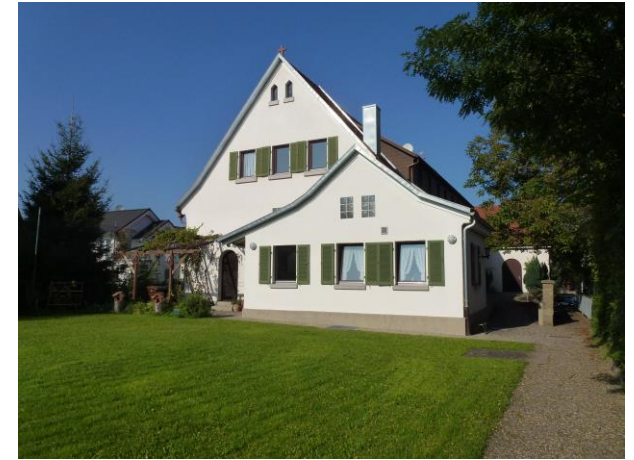
Evangelisches Gemeindehaus, Adlerstraße 1